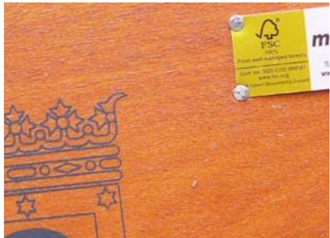
Madrid shield and FSC label in urban furniture (street benches)

Viimase mõne aasta jooksul on Madrid arendanud poliitikat, mille eesmärgiks on mini. Meerida mõju keskkonnaale ja paredada kaupade ja teenuste ostmise sotsiaalseid kriteeriume. 2005. aastal võttis linnanõukogu vastu Avaliku Hanke „Hea Jätkusuutlike Praktikat Koodeksi“ (Codigo de Buenas Practicas Sostenibles en la Contratacion Local), mida redigeeriti 2010. aastal – selleks, et „saavutada vahe kuluefektiivsuse ja jätkusuutlikkuse kõrgemaid tasandeid, et parendada kodanike elukvaliteeti, samal ajal keskkondlike mõjude minimeerimisega, et muuta tarbimisharjumusi rohkem jätkusuutlikumaks ja ette näha tulevast seadusandlust.“